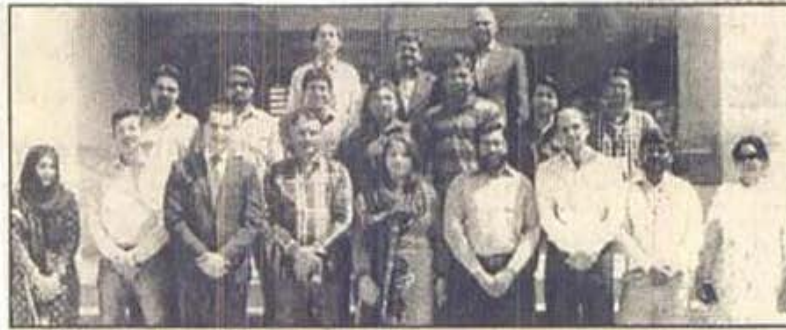
زونگ نے صحافیوں کے لئے انسٹیٹیوٹ آف بزنس ایڈمنسٹریشن، ہٹی کیمپس کراچی میں برانچ لیس بینکنگ پر ایک تربیتی ورکشاپ کا انعقاد کیا۔ گروپ تصویر میں صحافی ٹرینرز اور زونگ کے نمائندوں کے ہمراہ موجود ہیں