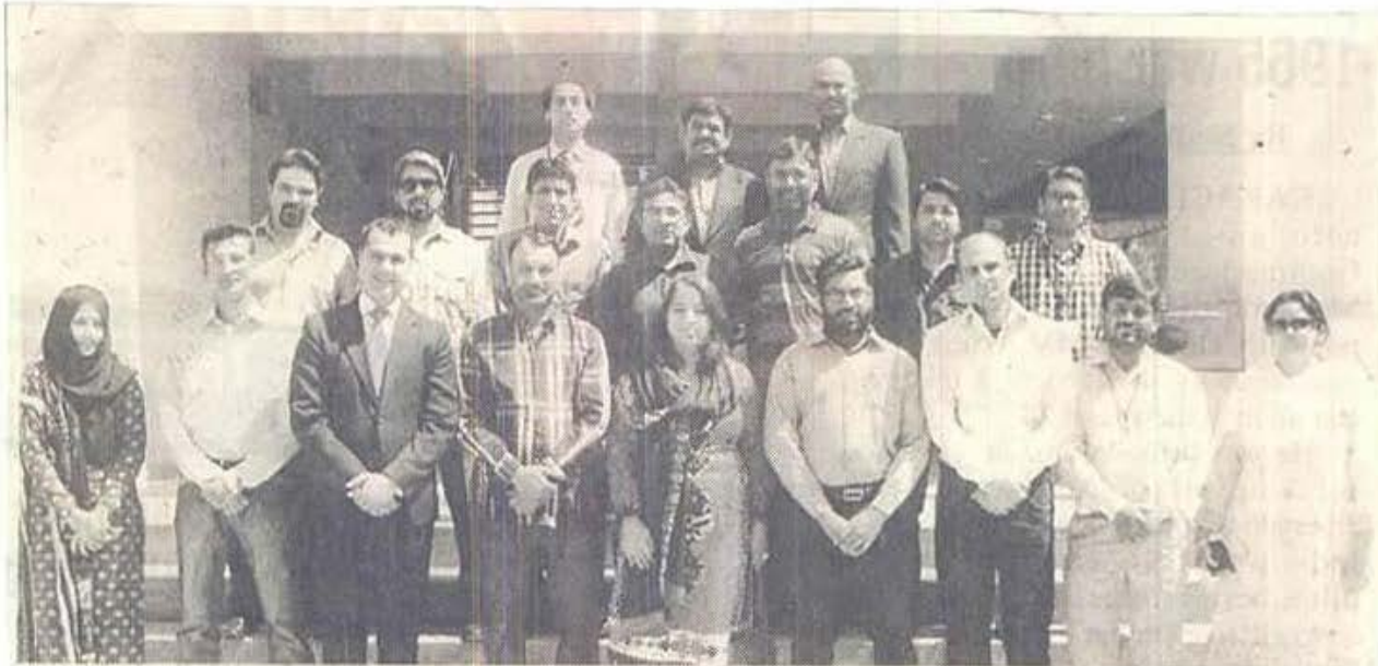
Zong held a training workshop on branchless banking for journalists at the Institute of Business Administration, City Campus Karachi. Picture shows journalists with trainers and Zong representatives.