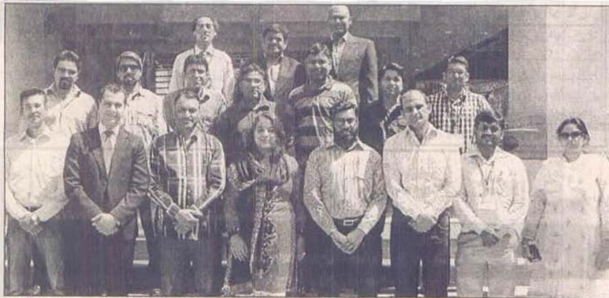
کراچی میں زونگ کے زیر اہتمام صحافیوں کے لیے براچ لیس بینکنگ سے متعلق تربیتی ورکشاپ کے شرکاء کا گروپ فوٹو