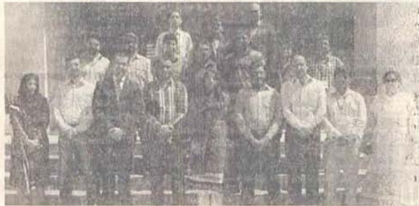
KARACHI: Zong held a training workshop on branchless banking at IBA, City Campus. Picture shows journalists with trainers and Zong representatives.