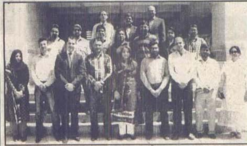
زونگ نے صحافیوں کیلئے اسٹیٹیوٹ آف بزنس ایڈمنسٹریشن، مٹی کیمپس کراچی میں براؤنچ لیس بیکنگ پرائیکٹریٹی ورکشاپ کا انعقاد کیا، گروپ تصویر میں صحافی ٹرینرز اور زونگ کے نمائندوں کے ہمراہ موجود ہیں